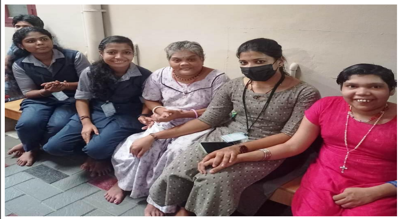
Meal Sharing Campaign (Pothichoru) - On going Activity